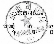
律师事务所年度检查考核记录